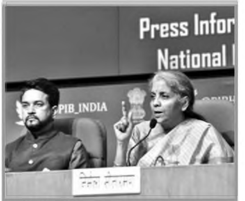
Union finance minister Nirmala Sitharaman along with Mos finance Anurag Thakur during the post-budget Press conference, at National Media Centre, in the Capital on Monday. SNS

Budget turns paperless: From finance minister Nirmala Sitharaman reading out her 110-minute speech from a tablet to seating arrangements in tune with pandemic times, there were quite a few firsts during the presentation of the 2021-22 Union Budget in the Lok Sabha on Monday. Also, for the first time, the Budget went paperless and members were provided soft copies of the speech and documents. Sitharaman continued with the practice of carrying the red-coloured 'bahi khata'. Only that this time around, tablet replaced papers in the red bag. SNS