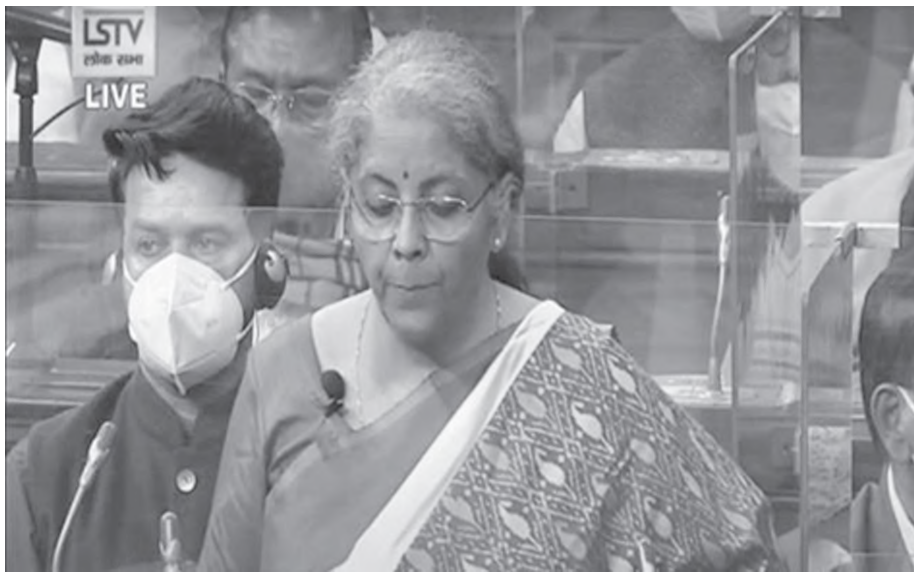
ਵਿੱਤ ਮੰਤਰੀ ਨਿਰਮਲਾ ਸੀਤਾਰਮਨ ਨੇ ਆਪਣੇ ਬਜਟ 2021 'ਚ ਹਰ ਖੇਤਰ ਲਈ ਕੋਈ ਨਾ ਕੋਈ ਮਹੱਤਵਪੂਰਨ ਐਲਾਨ ਕੀਤਾ ਹੈ। ਇਸ 'ਚ ਸਿਹਤ, ਰੇਲ, ਤਕਨੀਕ, ਰੋਜ਼ਗਾਰ ਤੇ ਸਿੱਖਿਆ ਨੂੰ ਲੈ ਕੇ ਔਰਤਾਂ ਤਕ ਸ਼ਾਮਿਲ ਹਨ। ਔਰਤਾਂ ਨੂੰ ਇਸ ਬਜਟ ਤੋਂ ਖਾਸ ਉਮੀਦ ਸੀ ਤੇ ਸਰਕਾਰ ਵੀ ਉਨ੍ਹਾਂ ਦੀਆਂ ਉਮੀਦਾਂ 'ਤੇ ਖਾਹ ਉਤਰਨ ਦੀ ਕੋਸ਼ਿਸ਼ ਕੀਤੀ ਹੈ।

ਸਰਕਾਰ 2022 ਤਕ ਕਿਸਾਨਾਂ ਦੀ ਆਮਦਨ ਦੁਗਣੀ ਕਰਨ 'ਤੇ ਕਾਇਮ ਹੈ। ਵਿੱਤ ਮੰਤਰੀ ਨਿਰਮਲਾ ਸੀਤਾਰਮਨ ਨੇ ਦੱਸਿਆ ਕਿ ਮਲਕੀਅਤ ਯੋਜਨਾ ਨੂੰ ਹੁਣ ਦੇਸ਼ ਭਰ 'ਚ ਲਾਗੂ ਕੀਤਾ ਜਾਵੇਗਾ। ਐਗਰੀਕਲਚਰ ਦੇ ਕ੍ਰੇਡਿਟ ਟਾਰਗੇਟ ਨੂੰ 16 ਲੱਖ ਕਰੋੜ ਤਕ ਕੀਤਾ ਜਾ ਰਿਹਾ ਹੈ।