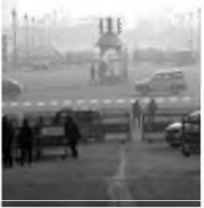
Cold and foggy weather in the Capital on Monday. SUBRATA DUTTA

Dumping homeless people: Taking cognisance of officials dumping homeless people outside Indore amid the biting cold, the Madhya Pradesh Human Rights Commission (MPHRC) has sought a report from the state's chief secretary and senior officers of Indore, an official said on Monday. PTI