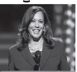
ਕਮਲਾ ਹੈਰਸ ਨੇ ਵਾਈਸ ਪ੍ਰੈਜ਼ੀਡੈਂਟ ਬਣ ਕੇ ਅਮਰੀਕਾ ਅਤੇ ਭਾਰਤ ਦੇ ਸਬੰਧਾਂ ਨੂੰ ਹੋਰ ਮਜ਼ਬੂਤ ਕੀਤਾ-ਵਾਈਟ ਹਾਊਸ

ਨਵੀਂ ਦਿੱਲੀ (ਬਿਊਰੋ)-ਭਾਰਤ ਦੀ ਜਮਪਲ ਕਮਲਾ ਹੈਰਸ ਹੁਣ ਅਮਰੀਕਾ ਦੀ ਵਾਈਸ ਪ੍ਰੈਜ਼ੀਡੈਂਟ ਬਣ ਗਈ ਹਨ ਅਤੇ ਉਹਨਾਂ ਦੀ ਚੋਣ ਅਮਰੀਕਾ ਦੇ ਨਵੇਂ ਚੁਣੇ ਗਏ ਪ੍ਰੈਜ਼ੀਡੈਂਟ ਜੋ ਬਾਈਡਨ ਦੇ ਨਾਲ ਹੀ ਹੋਈ ਹੈ। ਵਾਈਟ ਹਾਊਸ ਦੀ ਜੈਨ ਸਾਕੀ ਨੇ ਕਿਹਾ ਹੈ ਕਿ "ਕਮਲਾ ਹੈਰਸ ਦੇ ਅਮਰੀਕਾ ਦੇ ਵਾਈਸ ਪ੍ਰੈਜ਼ੀਡੈਂਟ ਬਣਨ ਨਾਲ ਅਮਰੀਕਾ ਅਤੇ ਭਾਰਤ ਦੇ ਸਬੰਧਾਂ ਨੂੰ ਹੋਰ ਮਜ਼ਬੂਤ ਕੀਤਾ ਹੈ।"