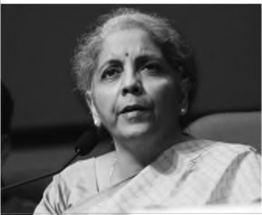
Union finance minister Nirmala Sitharaman addressing the post-Budget Press conference on Monday.

Announces various projects that would boost infra sector like NIP to cover 7,400 projects by 2025