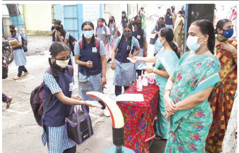
சென்னை அசோகநகர் மேல்நிலைப் பள்ளியில் மாணவிகள் கிருமி நாசினி மூலம் கைகளை சுத்தப்படுத்தி வகுப்பறைக்குள் அனுமதிக்கப்பட்டன.