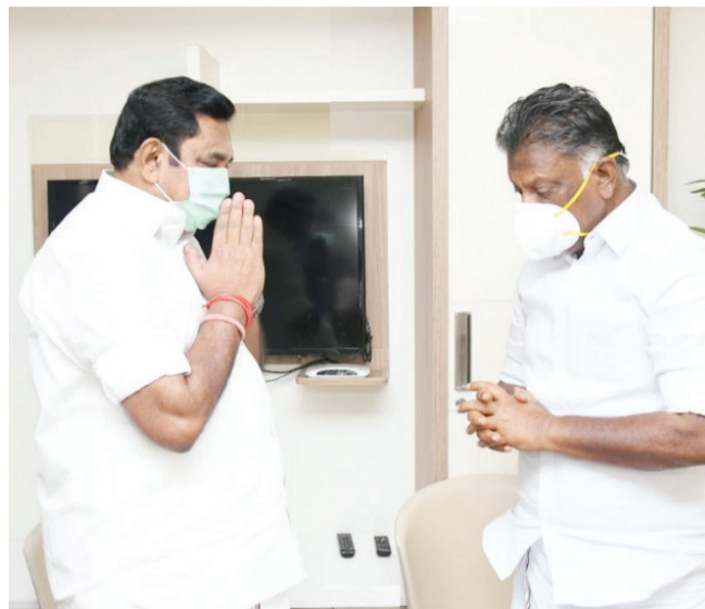
ஓ.பன்னீர்செல்வத்திற்கு, எடப்பாடி பழனிசாமி ஆறுதல் கூறினார்.