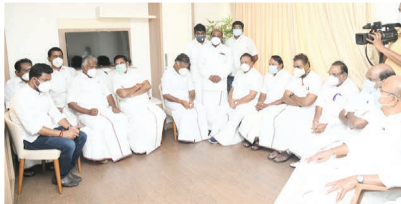
ஓ.பன்னீர்செல்வத்திற்கு, எடப்பாடி பழனிசாமி தலைமையில் அண்ணா தி.மு.க. நிர்வாகிகள் ஆறுதல் கூறினார்.

கம்ப்யூனிஸ்ட் கம்ப்யூனிஸ்ட் கட்சி தமிழ்நாடு மாநிலச் செயலாளர் இரா.முத்தரசன் வெளியிட்ட இரங்கல் செய்தியில்