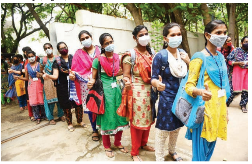
அண்ணாநகர் வள்ளியம்மாள் கல்லூரியில் மாணவிகள் வரிசையாக வகுப்பறைக்குள் சென்றனர்.

பல்கலைக் கழகத்தில் உள்ள ஆய்வுக் கூடத்தில் 7 ஆம் பருவத்தில் படிக்கும் மாணவர்களுக்கு பயிற்சி வகுப்புகள் நடத்தப்படுகின்றன. அவர்களுக்கு காலை 8 மணி முதல் இரவு 8 மணி வரை பயிற்சி வகுப்புகள் நடைபெறுகின்றன. ஒரு பயிற்சி வகுப்பிற்கு 20 மாணவர்கள் மட்டுமே அனுமதிக்கப்படுகின்றனர். அதேபோல் வகுப்பறையிலும் 20 மாணவர்கள் மட்டுமே அனுமதிக்கப்படுகின்றனர்.