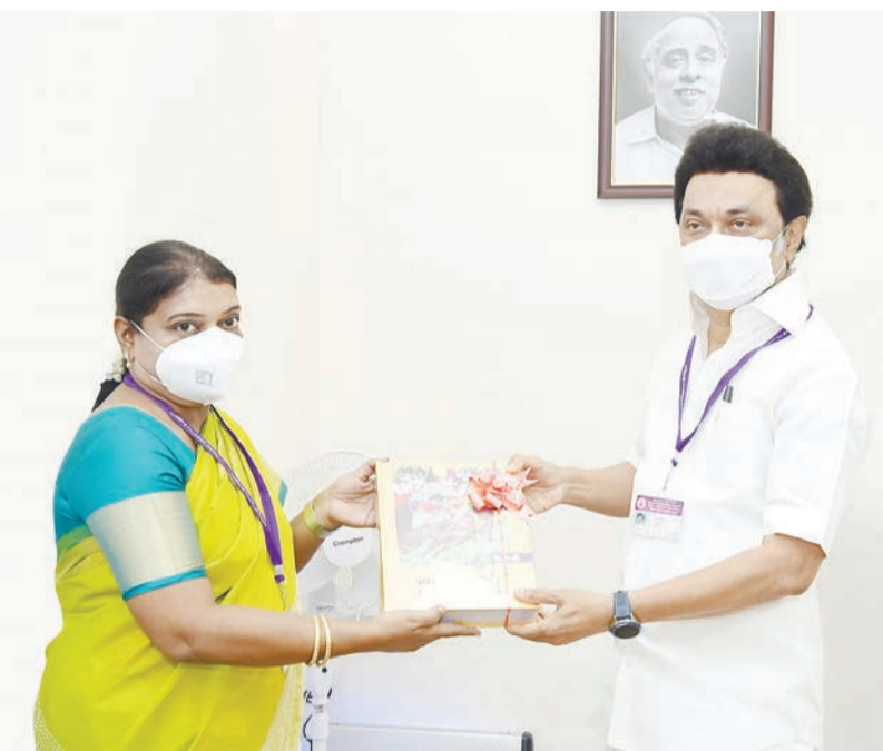
முதலமைச்சர் மு.க.ஸ்டாலினை, சமூக நலன் மற்றும் மகளிர் உரிமைத் துறை அமைச்சர் 2021-22ம் ஆண்டிற்கான சமூக நலன் மற்றும் மகளிர் உரிமைத் துறை மாணியக் கோரிக்கை மீதான விவாதத்திற்கு முன்னதாக சந்தித்து வாழ்த்து பெற்றார்.

இலவச பயண சீட்டு மேலும் 1995ம் ஆண்டு முதல் ஒன்றிய அரசு மாதம் ஒன்றுக்கு ரூபாய் 200 மட்டும் வழங்கப்பட்ட ஓய்வூதியத் திட்டத்தில் தமிழ்நாடு அரசால் மாதம் ரூபாய் 800 கூடுதலாக சேர்த்து ரூபாய் 1000 மாத ஓய்வூதியம் வழங்கப்பட்டு வருகிறது. முதியோர் எளிதாக பயணம் மேற்கொள்ள வசதியாக இலவச பயண சீட்டு மாநில அரசால்