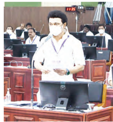
Karunanidhi introduced Slum Clearance Board to improve the life style of slum dwellers.

Through the Board, Karunanidhi he built tens of thousands of apartments. Former Union Minister. Babu Jegajivanram himself has mentioned and praised the project. He also expressed his intention to bring this project not only in Tamil Nadu but also in other states in India