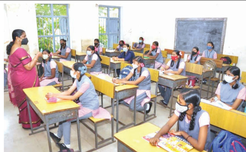
நுங்கம்பாக்கம் பெண்கள் மேல்நிலைப் பள்ளியில் மகிழ்ச்சியுடன் மாணவிகள்