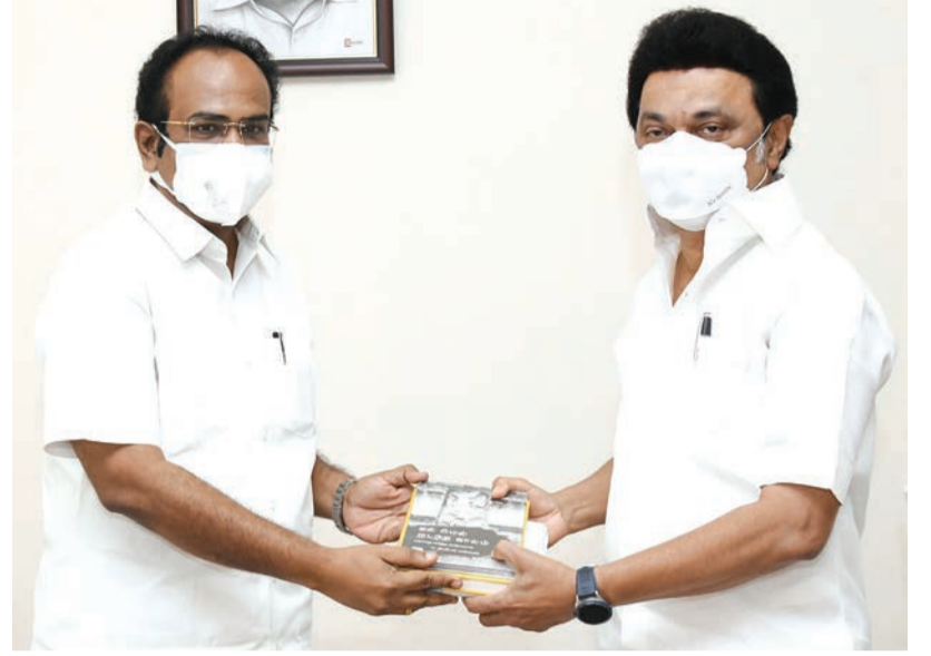
முதலமைச்சர் மு.க.ஸ்டாலினை, தொழில் துறை அமைச்சர் தங்கம் தென்னரசு 2021-22 ஆண்டிற்கான தொழில் துறை மற்றும் தமிழ் வளர்ச்சித் துறை மானியக் கோரிக்கை மீதான விவாதத்திற்கு முன்னதாக சந்தித்து வாழ்த்து பெற்றார்.

பணிபுரியும் மகளிரின் பாதுகாப்பினை கருத்தில் கொண்டு ரூ.70 கோடி திட்ட மதிப்பீட்டில், 2 ஏக்கர் பரப்பளவில் சிறுசேரி சென்னை, செப்.1 மாவட்டம் சிப்காட் தொழிற்பூங்காவில், 250 ஏக்கர் பரப்பளவில், ரூ.400 கோடியில் ஒருங்கிணைந்த ஆடைப்பூங்கா உருவாக்கப்படும் என்று சட்டசபையில் அமைச்சர் தங்கம் தென்னரசு அறிவித்தார். தென் மாவட்டங்கள் பொருளாதார வளர்ச்சி அடையும் வகையில், விருதுநகர் மாவட்டம் குமாரசிங்கபுரம் சிப்காட் தொழிற்பூங்காவில், 250 ஏக்கர் பரப்பளவில், ரூ.400 கோடி திட்ட மதிப்பீட்டில், உலகத்தரம் வாய்ந்த உள்சுட்டமைப்பு வசதிகளுடன் ஒருங்கிணைந்த ஆடைப்பூங்கா உருவாக்கப்படும். திருவள்ளூர் மாவட்டம், ஊத்துக்கோட்டை வட்டம், செங்காத்தாளுத்தில், 576 ஏக்கர் பரப்பளவில் ரூ.250 கோடி திட்ட மதிப்பீட்டில், அடிப்படை மற்றும் சிறப்பு உள்ளகட்டமைப்பு வசதிகளுடன் புதிய சிப்காட் தொழிற்பூங்கா உருவாக்கப்படும். இயற்கை சூழலை பாதுகாத்திடவும், தொழிற்சாலைகளின் செயல்பாடு மேம்படவும், அடிப்படை கட்டமைப்பு வசதிகளுடன் ரூ.150 கோடி திட்ட மதிப்பீட்டில் 10 சிப்காட் தொழிற்பூங்காக்கள் மேம்படுத்தப்படும். சிப்காட் தொழிற்பூங்காக்கள் நீர் ஆதாரத்தில் தன்னிறைவு பெறவும், நீர்நிலைகளை சுற்றிலும் பசுமை சூழல் உருவாக்கும் பொருட்டும், சிப்காட் தொழிற்பூங்காக்கள் மற்றும் அதன் சுற்றுப்புறத்தில் உள்ள நீர்நிலைகள் ரூ.100 கோடி திட்ட மதிப்பீட்டில் மறுசீரமைக்கப்படும். பணிபுரியும் மகளிரின் பாதுகாப்பினை கருத்தில் கொண்டு ரூ.70 கோடி திட்ட மதிப்பீட்டில், 2 ஏக்கர் பரப்பளவில் சிறுசேரி