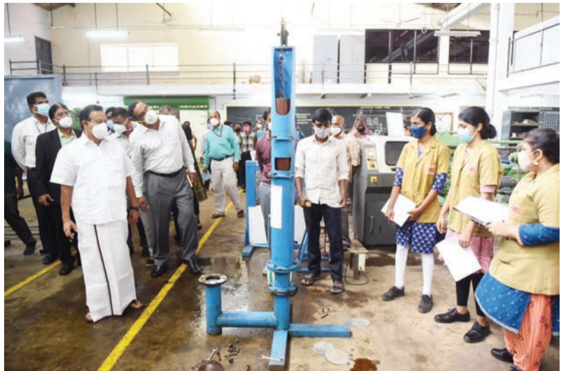
கிண்டி அண்ணா பல்கலைக் கழகத்தில் உள்ள ஆய்வுக் கூடத்தில் அமைச்சர் க.பொன்முடி ஆய்வு செய்தார்.

கியாஸ் சிலிட்டர் ஒன்றின் விலை 875 ரூபாயில் இருந்து ரூ.25 உயர்ந்து ரூ.900.50 ஆக அதிகரித்துள்ளது. வணிக அளவில் பயன்படுத்தப்படும் சமையல் கியாஸ் சிலிட்டர் விலை ரூ.75 உயர்ந்து ரூ.1,831க்கு விற்கப்படுகிறது. கடந்த ஓராண்டில் மட்டும் வீட்டு உபயோக கியாஸ் சிலிட்டர் விலை ரூ.285 ஆக உயர்ந்துள்ளது. இந்த விலை உயர்வு இல்லத்தரசிகள் மற்றும் பெண்கள் இடையே மிகுந்த அதிருப்தியை ஏற்படுத்தியுள்ளது. கொரோனாவால் மக்கள் வருவாய் இன்றி, வாழ்வாதாரம் பாதிக்கப்பட்டு, சிரமத்திற்கு உள்ளாகி வரும் சூழலில், சிலிட்டர் விலை உயர்த்தப்பட்டிருப்பது மிகுந்த சிரமத்தை ஏற்படுத்துவதாக அவர்கள் தெரிவித்தனர்.