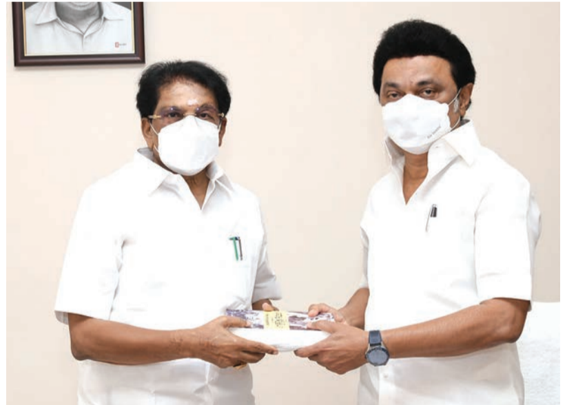
முதலமைச்சர் மு.க.ஸ்டாலினை, வருவாய் மற்றும் பேரிடர் மேலாண்மைத் துறை அமைச்சர் கே.கே.எஸ்.எஸ்.ஆர்.ராமச்சந்திரன், 2021-22 ஆண்டிற்கான வருவாய் மற்றும் பேரிடர் மேலாண்மைத் துறை மானியக் கோரிக்கை மீதான விவாதத்திற்கு முன்னதாக சந்தித்து வாழ்த்து பெற்றார்.

எல்லையை அளந்து காட்டுக் கோரி பொதுமக்கள் எங்கிருந்தும் இணையம் வாயிலாக வசதியை வசதியை அறிமுகப்படுத்துதல். மத்திய நில அளவை அலுவலகம் மற்றும் நிலவரித் திட்ட அலுவலகங்களில் பராமரிக்கப்பட்டு வரும் பழமையான ஆவணங்களை ஒளிபிம்ப நகல்