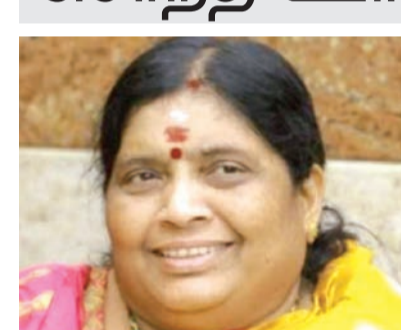
உள்ள ஜெம் மருத்துவமனையில் சிகிச்சைக்காக அனுமதிக்கப்பட்டு தொடர்ந்து சிகிச்சை அளிக்கப்பட்டு வந்தது. தீவிர சிகிச்சைப் பிரிவில் அண்ணா தி.மு.க. இணை