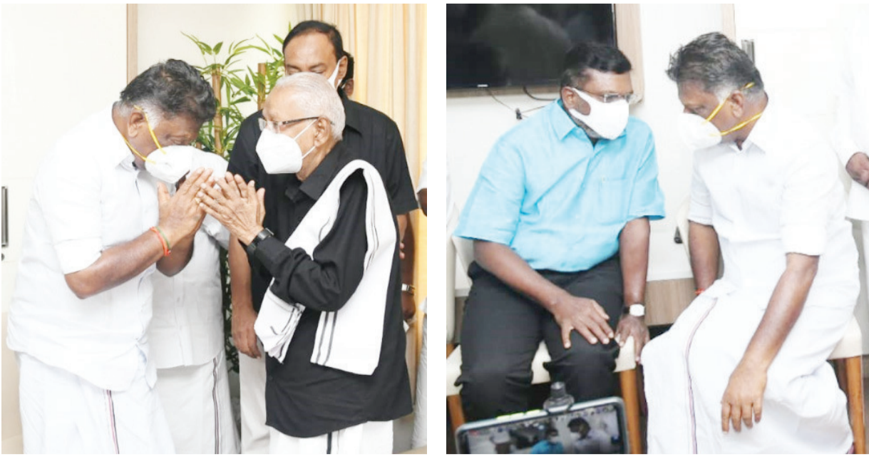
ஓ.பன்னீர்செல்வத்திற்கு, திராவிட கழகத் தலைவர் கீ.வீரமணி ஆறுதல் கூறினார்.