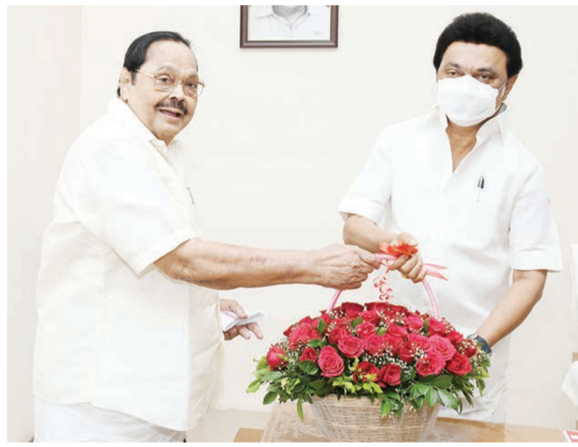
முதலமைச்சர் மு.க.ஸ்டாலினை, நீர்வளத் துறை அமைச்சர் துரைமுருகன், 2021-22 ஆண்டிற்கான தொழில் துறை (சுரங்கங்கள் மற்றும் கனிமங்கள்) மானியக் கோரிக்கை மீதான விவாதத்திற்கு முன்னதாக சந்தித்து வாழ்த்து பெற்றார்.

குவாரிப்பணிகளில் இருந்து வரலாற்று சின்னங்கள், பழந்தமிழர் கல்வெட்டுகள், சமணப்படுகை மற்றும் தொல்பொருள் தளங்கள் பாதுகாக்கப்படும். கட்டுமானப் பணிகளில் ஆற்று மணலுக்கு மாற்றாக சமீப காலமாக எம்.சாண்ட் உபயோகம் அதிகரித்து வருகிறது. இந்த நிலையில், தரமற்ற எம்.சாண்டியை சந்தைகளில் விற்பனை செய்வதை தடுக்கவும், கண்காணிக்கப்படும். எம்.சாண்ட் தயாரிப்பு, தரம், விலை மற்றும் அவற்றை கொண்டு செல்லுதல்