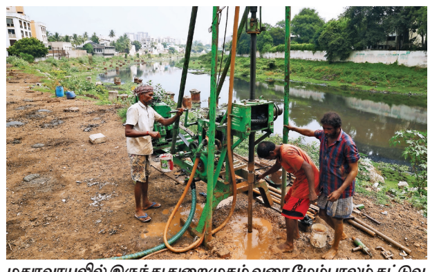
மதுரவாயலில் இருந்து துறைமுகம் வரை மேம்பாலம் கட்டுவதற்காக சேத்துப்பட்டு ஹாரிங்ஸ் சாலை கூலம் ஓரம் மண் பரிசோதனை நடக்கிறது. இதற்கான பணியில் ஈடுபட்டுள்ள தொழிலாளர்கள்.

கடந்தாண்டு கொலை மிரட்டல் விடுத்த ஒருவரை கைது செய்தோம்' என்றனர்.