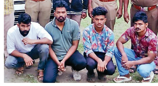
கைதான 4 பேர்.

கூடலூர், அக்ட. 28-கேரளாவுக்கு காரில் கடத்த முயன்ற ரூ.5 லட்சம் மதிப்பிலான எம்டிஎம் போதை பொருளை பறிமுதல் செய்த போலீசார் கேரள வாலிபர்கள் 4 பேரை கைது செய்தனர்.