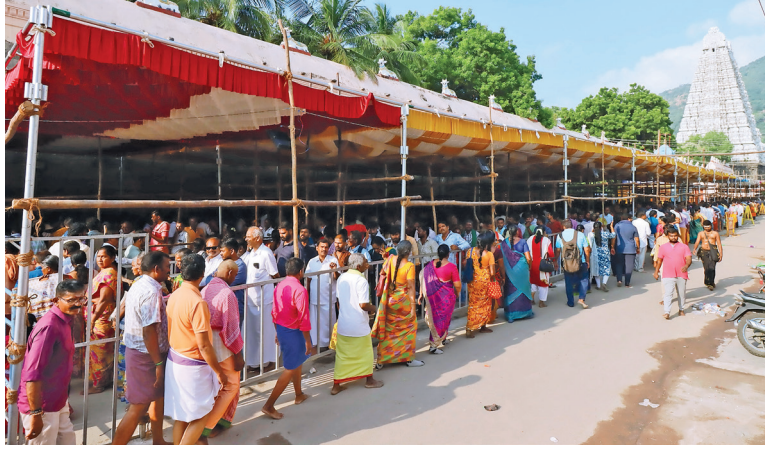
திருவண்ணாமலையில் இன்று காலை கிரிவலம் சென்ற பக்தர்கள். அடுத்தபடம்: அண்ணாமலையார் கோயிலில் தரிசனம் செய்வதற்காக வட ஓத்தவாடை தெருவில் நீண்ட வரிசையில் காத்திருந்த பக்தர்கள்.

ஐப்பசி மாதம் அஸ்வினி நட்சத்திரத்தன்று சிவபெருமானுக்கு அன்னதால் அபிஷேகம் செய்யப்படுகிறது. அதன்படி, அண்ணாமலையார் கோயிலில் பிரசித்தி பெற்ற அன்னாபிஷேக விழா இன்று நடக்கிறது. இதையொட்டி மாலை 3 மணி முதல் மாலை