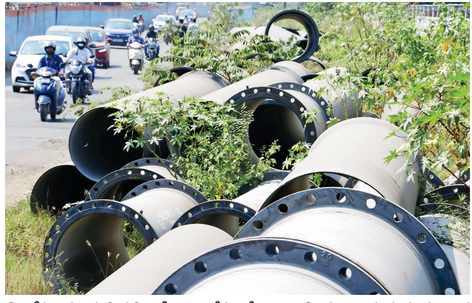
சோழிங்கநல்லூர் செம்மொழி சாலையில் வரிசையாக போட்டு வைக்கப்பட்டுள்ள ராட்சத குழாய்கள் வீணாகி வருகிறது. அவற்றை உடனடியாக பணிகளுக்காக பயன்படுத்த வேண்டும் என சமூக ஆர்வலர்கள் கோருகின்றனர்.