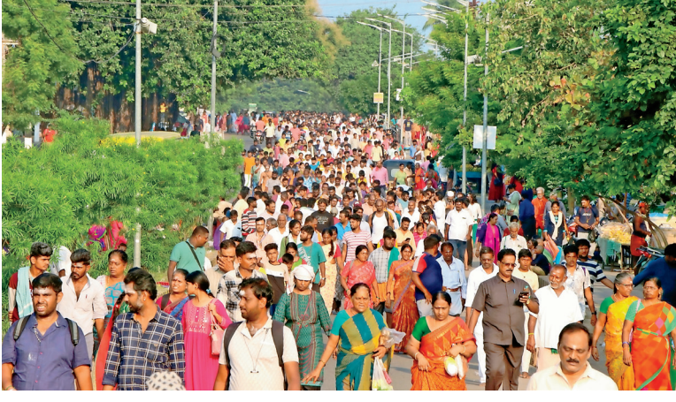
திருவண்ணாமலையில் இன்று காலை கிரிவலம் சென்ற பக்தர்கள். அடுத்தபடம்: அண்ணாமலையார் கோயிலில் தரிசனம் செய்வதற்காக வட ஓத்தவாடை தெருவில் நீண்ட வரிசையில் காத்திருந்த பக்தர்கள்.

திருவண்ணாமலை, அக்ட.28-திருவண்ணாமலையில் மாதந்தோறும் பவுர்ணமியன்று லட்சக்கணக்கான பக்தர்கள் கிரிவலம் சென்று வழிபடுகின்றனர். அதன்படி, ஐப்பசி மாத பவுர்ணமி கிரிவலம் செல்ல உகந்த நேரம் இன்று(28ம் தேதி) அதிகாலை 4.02 மணிக்கு தொடங்கி, நாளை (29ம் தேதி) அதிகாலை 2.48 மணிக்கு நிறைவடைகிறது. இதையொட்டி இன்று அதிகாலை அண்ணாமலையார் கோயிலில் நடை திறக்கப்பட்டு திருப்பள்ளி எழுச்சி, கோபுஜை நடைபெற்றது. பின்னர் அபிஷேகம், அலங்காரம் செய்யப்பட்டு மகா தீபாராதனை நடைபெற்றது. அதிகாலை முதலே ஏராளமான பக்தர்கள் நீண்ட வரிசையில் காத்திருந்து சுவாமி தரிசனம் செய்துவருகின்றனர். மேலும் ஆயிரக்கணக்கான பக்தர்கள் காலை முதலை கிரிவலம் சென்றனர்.