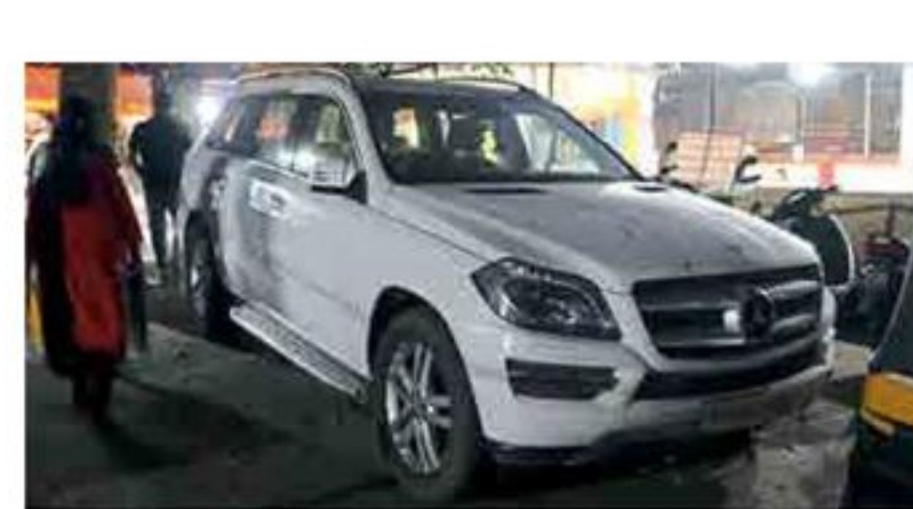
कल्याण : पोलिसांनी जप्त केलेली मर्सिडीज कार.

व देखरेखीसाठी ६६ आरपीएफ कर्मचारी नियुक्त करण्यात येणार असल्याचे आरपीएफकड्न सांगण्यात आले आहे.