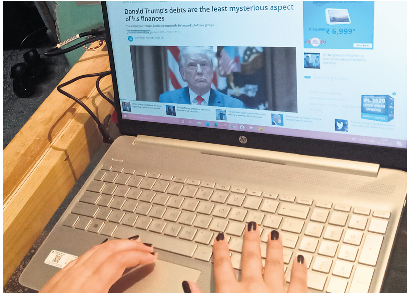
Digital news outlets would have to adhere to conditions like a majority of directors on the board and its chief executive officer being Indian citizens.

The benefits would include Press Information Bureau accreditation for reporters, camerapersons and videographers to help them have better first-hand information and access, including participation in official press conference and other such interactions. It would also include availability of Central Government Health Scheme benefits and concessional rail fare to those with accreditation and make such organisations eligible for digital advertisements through the Bureau of Outreach and Commu-