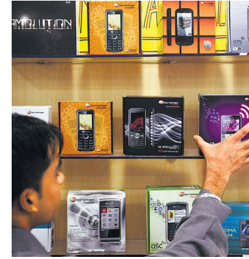
Micromax will stop making cheap phones, the co-founder said.

In October, the government approved Bhagwati Products, the maker of Micromax phones under the PLI scheme, along with 15 other companies, which include Rising Star, Wistron and Pegatron. Except for Samsung, all the other foreign