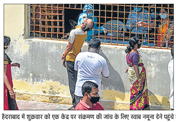
हैदराबाद में शुक्रवार को एक केंद्र पर संक्रमण की जांच के लिए स्वाब नमूना देने पहुंचे लोग।

नई दिल्ली | हिन्दुस्तान ब्यूरो कोरोना के गंभीर मरीजों के इलाज में सबसे कारगर मानी जा रही रेमडेसिविर समेत कई दवाएं क्लीनिकल परीक्षण में विफल पाई गई हैं। विश्व स्वास्थ्य संगठन ने परीक्षण के शुरुआती नतीजे जारी करते हुए बताया कि यह दवा गंभीर मरीजों की जान बचाने में असफल साबित हुई। भारत ही नहीं, लगभग 50 देशों में इसी दवा से कोरोना के गंभीर मरीजों का इलाज किया जा रहा था। ट्रैप को भी रेमडेसिविर का इंजेक्शन लगाया गया था। कई दवाएं बेकार : विश्व स्वास्थ्य संगठन के मुताबिक, रेमडेसिविर हाइड्रोक्सीक्लोरोक्वीन, एचआईवी की दवा लोपिनाविर व रीटानावीर और इंटरफेरॉन भी कारगर नहीं पाई गईं। 28 दिन तक इलाज के बाद भी मरीजों को बचाने में फायदा नहीं दिखा। इलाज कर रहे मरीजों की सेहत पर भी ख़ास असर नहीं दिखा। इनका इस्तेमाल अभी तक इलाज के लिए का रहा था। सबसे बड़ा परीक्षण : छह महीने तक 30 से ज्यादा देशों में 11,266 मरीजों पर यह शोध किया गया। यह दुनिया का सबसे बड़ा रैंडम ट्रायल था, जिसमें