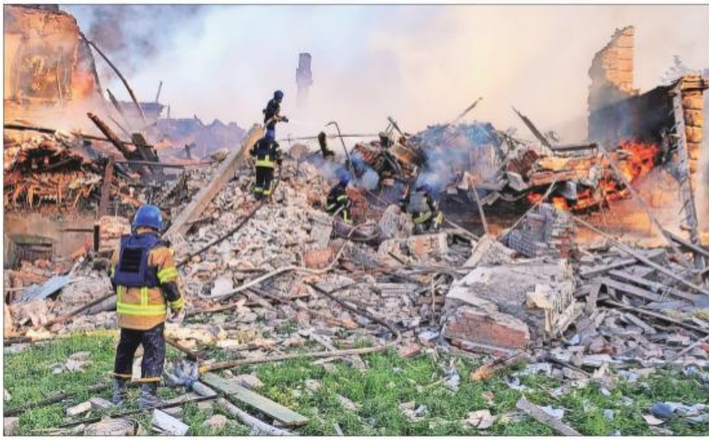
Debris of a partially collapsed school building in Ukraine, after it was hit in shelling

In a week-long operation brokered by the United Nations and the International Committee of the Red Cross (ICRC), scores of civilians who had taken refuge in the plant's