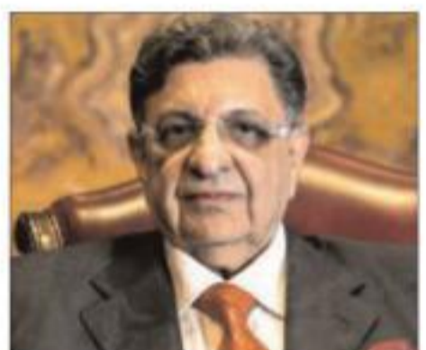
Serum Institute chairman & MD Cyrus Poonawalla

"The company has been following the low-cost, high-volume business model. Nearly two-thirds of the world's infant population is protected by one or more of our vaccines and most of Serum's vaccines have been used by poorer nations, Unicef