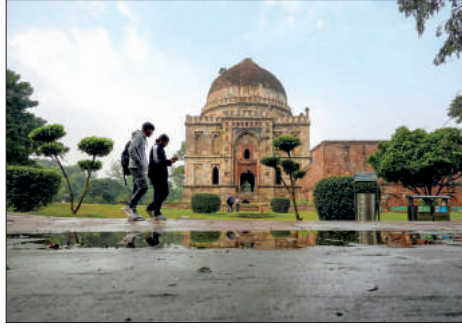
বৃষ্টিমান নোবি গোলী। টানা পোষাশ পর স্বস্তির বৃষ্টি দিল্লিতে।

দক্ষিণ ইজরায়েলের এইচটি শব্দের একটি স্থলে প্রবেশ হওয়া চলিয়েছিল বিহারের একটি গণিত গোলী।