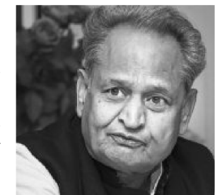
It is not clear what Chief Minister Ashok Gehlot's Plan B is if the governor does not accede to its request

The Rajasthan government on Tuesday told Governor Kalraj Mishra it wanted the legislative Assembly to meet on July 31 (which is Eid, a national holiday) and promised to meet all other conditions laid out by the governor in relation to Covid-19.