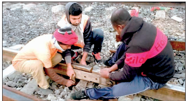
বানমাগাছিতে রেললাইনে ফিশ প্লেটের ফাটল। রবিবার।

ময়নাক্ষিতে রেল দুর্ঘটনার রেশ এখনও কাটেনি। রবিবার ফের বড়সড় ট্রেন দুর্ঘটনার হাত থেকে রক্ষা পেল ডাল্টন দপ্তরপুত্র লোকাল। এদিন সকালে বানমাগাছি স্টেশনের অদূরে জোর আওয়াজ পেয়ে সঙ্কেসঙ্কেই চালক ট্রেন থামিয়ে দেন। চালকের কাছ থেকে খবর পেয়েই রেলকর্মীরা ঘটনাস্থলে গিয়ে দেখেন রেললাইনের ফিশ প্লেট ভাঙা ছিল। রেললাইন সারাই করার পরই বনগাঁ শাখায় ট্রেন চালান স্বাভাবিক হয় এদিন। রেল সূত্রে জানা গেছে, গরম থেকে ঠান্ডা পড়লে রেললাইনে কিছু সমস্যা দেখা দেয়। এটা সেই ধরনেরই