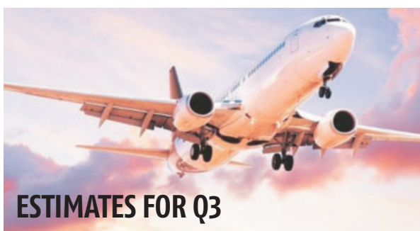
ESTIMATES FOR Q3

The civil aviation ministry removed the cap on domestic capacity in October and airlines were allowed to operate up to 100 per cent of their scheduled flights. The ban on