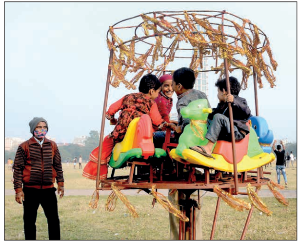
শীতের ময়দান। রবিবার।

কেন একমুখ পরিষ্কার? আবহাওয়া দপ্তর জানিয়েছে, মঙ্গলবার নতুন একটি পশ্চিমি বাঞ্ছা দানা বাঁধতে চলেছে পশ্চিম হিমালয় অঞ্চলে। শুক্রবার আরেকটি দানা বাঁধতে পারে উত্তর-পশ্চিম হিমালয় অঞ্চলে। জোড়া পশ্চিমি বাঞ্ছায় কাশ্মীর ও সংলগ্ন পার্বত্য এলাকায় বৃষ্টি অথবা তুষারপাতের পরিষ্কার তৈরি হবে। কনকনে আমেজ তৈরি হবে উত্তর ভারতে। তবে জোড়া পশ্চিমি বাঞ্ছার প্রভাবে উত্তরে হাওয়ার পথ বন্ধ হবে। স্বাভাবিক ভাবেই বাংলায় তাপমাত্রা বাড়তে শুরু করবে। উষ্ণও হবে শীতের আমেজ। এবার কী তবে আর শীত উপভোগ করা যাবে না? আবহাওয়া দপ্তর জানিয়েছে, জোড়া পশ্চিমি বাঞ্ছার প্রভাবে উত্তরে হাওয়ার পথ বন্ধ হবে। স্বাভাবিক ভাবেই বাংলায় তাপমাত্রা বাড়তে শুরু করবে। উষ্ণও হবে শীতের আমেজ। এবার কী তবে আর শীত উপভোগ করা যাবে না? আবহাওয়া দপ্তর জানিয়েছে, জোড়া পশ্চিমি বাঞ্ছার প্রভাবে উত্তরে হাওয়ার পথ বন্ধ হবে। স্বাভাবিক ভাবেই বাংলায় তাপমাত্রা বাড়তে শুরু করবে। উষ্ণও হবে শীতের আমেজ।