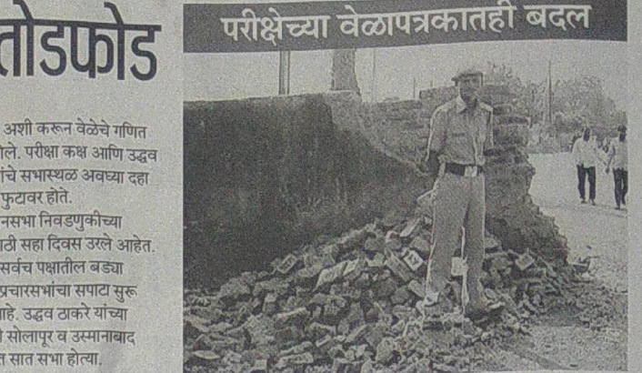
कऱ्यात आला. संरक्षक भिंत तोडणे व विद्यार्थ्यांच्या सहामाही परीक्षेच्या वेळापत्रकात बदल करण्यास

परिषद प्रशासनाने दिली होती. परवानगी देतेवेळी शाळा व परिसराची काळजी घेण्यात यावी, असे निर्देश देण्यात आले होते. मात्र, शिवसेनेने त्यांनी याला न जुमानता दोन ठिकाणी संरक्षक भिंत पाडली आहे. उद्धव ठाकरे यांच्या सभेमुळे शाळेतील सहामाही परीक्षेच्या वेळापत्रकात बदल करण्यात आला. शाळेत सोमवारी पाचवी ते आठवीची परीक्षा आणि नववी व दहावीचा गणित, विज्ञान आणि हिंदी विषयाची परीक्षा होती. शाळेची वेळ सकाळी ९ ते १२ होती. मात्र, ती ठाकरे यांच्या सभेमुळे ७.३० ते