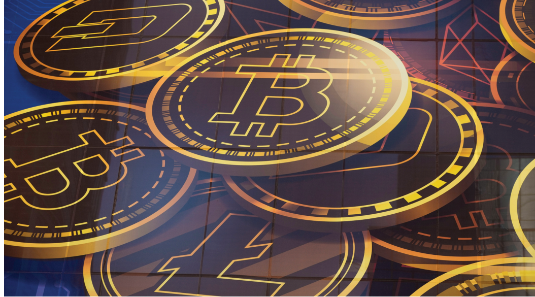
Thirteen years after bitcoin was created, cryptocurrencies remain largely unregulated.

Agencies also are seeking to claim territory. CFTC Chairman Rostin Behnam, a former staffer to Ms. Stabenow, said last week his agency is "ready and well situated" to oversee spot markets for some cryptocurrencies. He has worked with his former boss for months to help craft legislation that would authorize the CFTC to do so, people