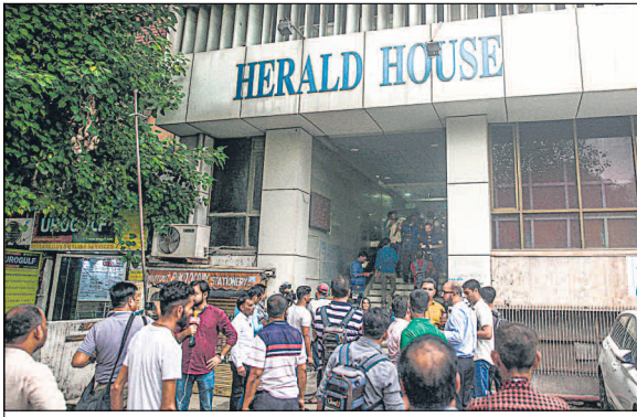
नेशनल हेराल्ड के दफ्तर को सील करने के दौरान मौजूद लोग।

नई दिल्ली, विशेष संवाददाता। कांग्रेस ने केंद्र सरकार पर आरोप लगाया है कि महंगाई, बेरोजगारी और खाद्य पदार्थों पर जीएसटी के मुद्दे पर प्रदर्शन को रोकने के लिए पार्टी मुख्यालय की घेराबंदी की है। इसके साथ कांग्रेस अध्यक्ष सोनिया गांधी और राहुल गांधी के घर की सुरक्षा बढ़ाई गई है। पार्टी का कहना है कि वह दबाव में नहीं आएगी और शुक्रवार को इन मुद्दों को लेकर देशव्यापी प्रदर्शन करेगी। नेशनल हेराल्ड मामले में यंग इंडियन का दफ्तर सील के बाद दिल्ली पुलिस ने कांग्रेस मुख्यालय, पार्टी अध्यक्ष सोनिया गांधी और पूर्व अध्यक्ष राहुल गांधी के घर के बाहर सुरक्षा बढ़ा दी। पार्टी मुख्यालय की तरफ जाने वाली सड़क बंद कर दी गई। इसके बाद पार्टी के वरिष्ठ नेता कांग्रेस मुख्यालय पहुंच गए। इसके बाद पार्टी नेताओं ने मुख्यालय में रणनीतिक बैठक की। कांग्रेस महासचिव जयराम रमेश, अजय माकन और अभिषेक मनु सिंघवी ने मीडिया से बात करते हुए आरोप लगाया कि सरकार उनका प्रदर्शन रोकने के लिए यह घेराबंदी कर रही है। माकन ने कहा कि कांग्रेस ने शनिवार (पांच अगस्त) को महंगाई, बेरोजगारी और खाद्य पदार्थों पर