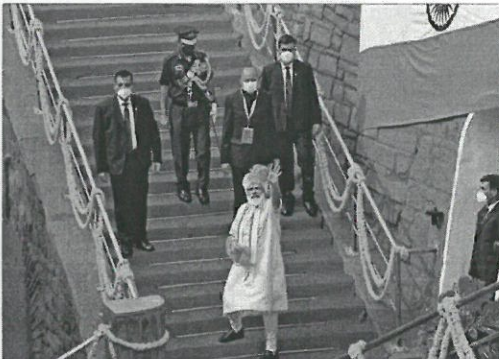
Prime Minister Narendra Modi waves after addressing the nation during the 74th Independence Day celebrations, at Red Fort in New Delhi.

HIGHLIGHTING KEY AGRICULTURAL reforms, Prime Minister Narendra Modi on Saturday said farm trade has been freed up from all restrictions, enabling farmers to sell their produce anywhere in the country. By drawing parallels with soap and cloth manufacturers who were able to sell their products anywhere at will, Modi said even after seven decades of Independence, farmers did not enjoy the freedom to trade their commodities beyond local mandis. In a seven-point straight Independence Day address from the ramparts of the Red Fort, the prime minister said that making farmers self-reliant has been a cornerstone of the Aatmanirbhar Bharat campaign and is also proving to be a value addition to cater to the needs of the global market. As part of the relief package to deal with the impact of the COVID-19 pandemic, the