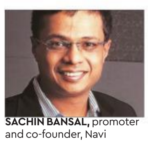
SACHIN BANSAL , promoter and co-founder, Navi

FE BUREAU Bengaluru, May 12 NAVI TECHNOLOGIES ON Thursday announced the appointment of Vidit Aatrey, co-founder & chief executive officer (CEO), Meesho, as an independent director on its board of directors effective April 9, 2022