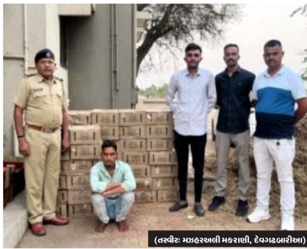
(તસ્વીર: મહારાજાની મહારાણી, દેવગઢબારીયા)

દેવગઢ બારીયા, થોસરથી પીસેલા ઘાસના ભુકાની આડમાં વિદેશી દારૂનો જથ્થો ભરીને આઈલેન્ડ તરફ જઈ રહેલી પીકપ બોલેરો ગાડીને પીપલોદ પોલીસે ભયવાડા ટોલનાકા પાસેથી પકડી પાડી ગાડીમાંથી રૂપિયા ૪.૬૫ લાખ ઉપરાંતની કિંમતનો વિદેશી દારૂનો જથ્થો તથા એક મોબાઇલ ફોન પકડી પાડી રૂપિયા ચાર લાખની કિંમતની પીકપ બોલેરો ગાડી મળી કુલ રૂપિયા ૮,૬૭,૬૦૦/- ના મુદામાલ સાથે ગાડીના ચાલકની અટકાયત કર્યાનું સત્તાવાર રીતે જાણવા મળ્યું છે. પ્રામ વિગત અનુસાર મધ્ય પ્રદેશ બાજુથી થોસરથી પીસેલા ઘાસના ભુકાની આડમાં વિદેશી દારૂનો વિપુલ જથ્થો ભરેલ જીજી.૦૫.બીએસ.૫૭૧૮ નંબરની પીકપ બોલેરો ગાડી આઈલેન્ડ તરફ જનાર હોવાની ગુમ ભાતમી પીપલોદ પોલીસને મળી હતી.