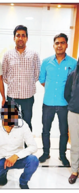
■ आरोपी अपराध कर चला गया था विदेश, एक साल बाद पकड़ा गया