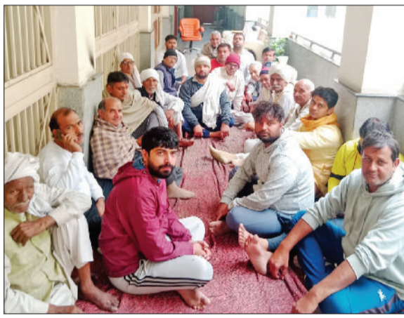
पुलिस ने बलपूर्वक तरीके से किसानों को हिरासत में ले लिया।

हिरासत में लेने के बाद किसानों में पुलिस और प्रशासन के प्रति रोष व्याप्त है। किसानों का कहना है कि दिल्ली पुलिस आयुक्त को पूर्व में सूचना प्रेषित करके हम शांतिपूर्वक तरीके से अपना धरना दे रहे हैं लेकिन मंगलवार को दिल्ली