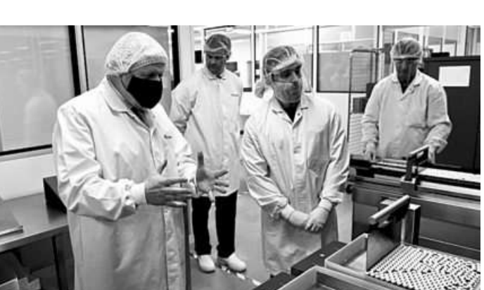
On Monday, UK Prime Minister Boris Johnson visited Wockhardt's Wrexham site, which has a capacity of 350 million doses

This would be a fill and finish facility and would get bulk vaccines from manufacturers such as ration. The UK site has a capacity AstraZeneca. It would then fill it of 350 million doses and if it is uti-