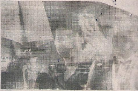
Congress leader Rahul Gandhi with party General Secretary...

A sessions court in Gujarat's Surat on Monday granted bail to Congress leader Rahul Gandhi after admitting his appeal against conviction in a 2019 criminal defamation case over his "Modi surname" remark in which he has been sentenced to two years in jail, a defence lawyer said.