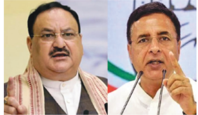
ஜெபி நடவடிக்கை வீட்டில் நேற்றிரவு

புதுடெல்லி, ஏப். 8- கர்நாடகா பாஜக வேட்பாளர்கள் தேர்வில் இழுபறி நீடிக்கும் நிலையில், அதற்கு காங்கிரஸ் கட்சியின் பொது பொதுச் செயலாளர் கிண்டல் தெரிவித்துள்ளார். 'முதல்வர் பசவராஜ் பொம்மை தனது தொகுதியில் போட்டியிட விரும்பவில்லை. அவர்களின் அமைச்சர்களும் தங்கள் தொகுதிகளில் தேர்தலில் போட்டியிட விரும்பவில்லை. வேட்பாளர்களை அக்கட்சி தேடி வருகிறது' என்றார். இந்த நிலையில் டெல்லியில் பாஜக தேசிய தலைவர் ஜெபி.பி.நடாவின் வீட்டில் நேற்றிரவு கர்நாடகா வேட்பாளர்கள் தேர்வு குறித்த ஆலோசனை கூட்டம் நடந்தது. இந்த கூட்டத்தில் உள்துறை அமைச்சர் அமித்ஷா, கர்நாடக முதல்வர் பசவராஜ் பொம்மை, மூத்த தலைவர் எடிடியாஸ் உள்ளிட்ட முக்கிய தலைவர்கள் கலந்து கொண்டனர். சுமார் 3 மணி நேரம் நடைபெற்று இந்த கூட்டத்தில், வேட்பாளர்களின் பெயர்கள் இறுதி செய்யப்பட்டதாக கூறப்படுகிறது. ஆனால் வேட்பாளர்கள் பட்டியலை இன்னும் வெளியிடவில்லை. மற்றொரு கூட்டத்தை நடத்திய பின்னர் வேட்பாளர்கள் பட்டியல் வெளியிடப்படும் என்று தகவல்கள் தெரிவிக்கின்றன.