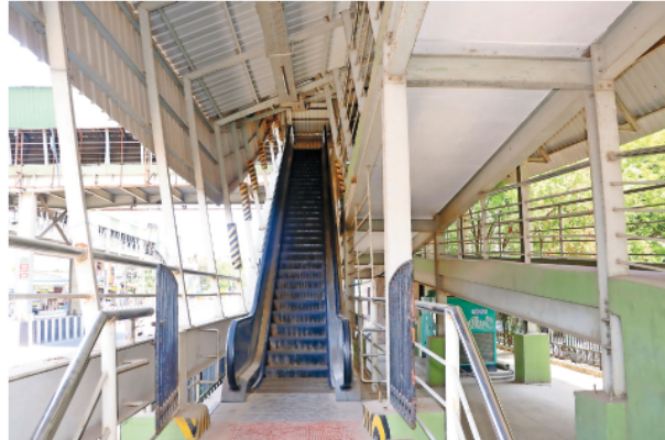
சென்னை தரமணி நெடுஞ்சாலை, ஸ்ரீராம் நகர் அருகே சாலையை கடக்க எஸ்கலேட்டர்டன் கூடிய நடைமேம்பாலம் அமைக்கப்பட்டுள்ளது. இந்த எஸ்கலேட்டர் பல நாட்களாக இயங்கவில்லை. இதனால் பொதுமக்கள் மிகவும் சிரமப்படுகின்றனர். விரைவில் சீரமைக்க கோரிக்கை விடுத்துள்ளனர்.