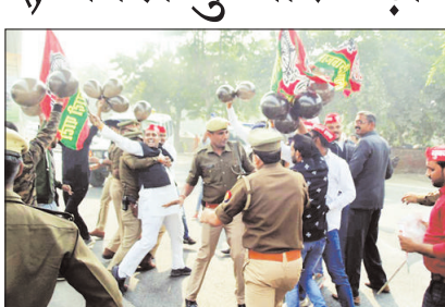
पॉलीटेक्निक मेट्रो यार्ड के बाहर विरोध प्रदर्शन कर रहे सपाइयों को खदेड़ती पुलिस।

शहर में मेट्रो के ट्रायल के लिए आये मुख्यमंत्री योगी आदित्यनाथ का विरोध सपाइयों ने सड़क पर उतरकर किया। उन्हीने काले गुब्बारे उड़ाकर अपना आक्रोश जताया। प्रदर्शन कर रहे सपाइयों को गिरफ्तार कर पुलिस लाइन भेज दिया। वहीं, कई सपाइयों को नजरबंद भी किया गया।