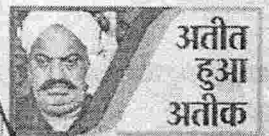
अतीक हुआ अतीक