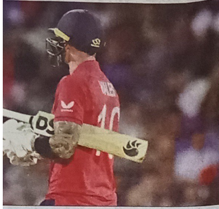
পাশে দিল ইংল্যান্ড

আরেকটু গতিশীল ইনিংস কি তিনি খেলাতে পারতেন না?