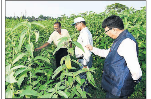
নতুন প্রজাতির পাট দেখছেন কৃষিবিজ্ঞানীরা।