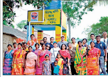
গ্রামবাসীদের সঙ্গে ওয়াটারএইড ইন্ডিয়া ও পেপসিকো ফাউন্ডেশনের কর্তব্যক্রিয়া।