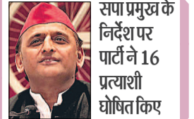
सपा प्रमुख के निर्देश पर पार्टी ने 16 प्रत्याशी घोषित किए

सपा ने धर्मेन्द्र यादव को बदालू से प्रत्याशी बनाया है जो आजमगढ़ लोकसभा उपचुनाव लड़ चुके हैं। सपा महासचिव स्वामी प्रसाद मौर्य