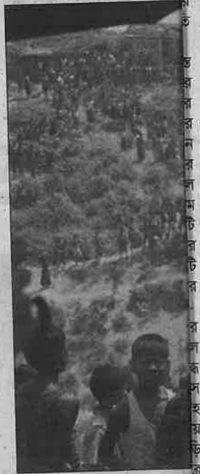
জঙ্গলের দায়ী করে এসব হামলা দমনাভিযানের সূচনা করেছে মাকে পরিস্থিতিকে অভ্যন্তরীণ

যুদ্ধাপরাধ ও মানবাধিকার লঙ্ঘনের ওইসব ঘটনার মধ্যে 'নিরাপরাধ গ্রামবাসীদের হত্যা ও তাদের বাড়িঘর ধ্বংস' করার ঘটনাও আছে বলে জানিয়েছে তারা। কিন্তু তাদের বিবৃতিতে প্যানেল ৩০টি পুলিশ পোস্টে হামলার জন্য রোহিঙ্গা