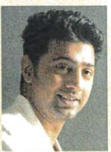
বাঘা যতীনের ফার্স্ট লুক

এখন তিনি ‘বাঘা যতীন’। গুটি চলেছে অক্ষয় রায়ে পর্মা বানাতে। এই ছবিতে তাকে, লেনে জানিয়েছেন তিনি ব্যোমকেশও বানাচ্ছে। বিরাট দাম্পত্য পর্মা বানাতে তৈরি হলে শব্দিত বন্দ্যোপাধ্যায়ের ‘দুর্বারহস্য’। কয়েক বছর ধরেই অভিনেতা হিসেবে নানান চ্যালেঞ্জ নিচ্ছেন লেনে। ‘বাঘা যতীন’ মেনে তার কাছে চ্যালেঞ্জের, ‘ব্যোমকেশ’ও তেমনি। দুর্বারহস্যের গুটি অবশ্য পেরি আছে। ‘বাঘা যতীন’ আসবে পরেরে।