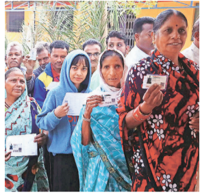
Voters show their identification cards while waiting in a queue to cast their votes in Chhattisgarh's Kanker district Tuesday.

A PROVISIONAL turnout of around 71 per cent was recorded in the first phase of Chhattisgarh Assembly elections for 20 constituencies Tuesday, voting for which was held in separate time slots, amid Maoist violence and the call for boycott, officials said. "A 70.87 per cent voter turnout was recorded till 5 pm in the first phase of the Chhattisgarh elections Tuesday. However, this figure may go up," a poll official said.