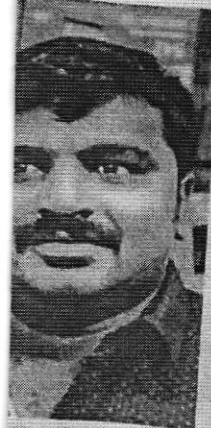
गमावलेले पिता- (उजवीकडे).