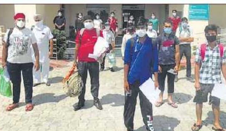
ਇਲਾਜ ਤੋਂ ਬਾਅਦ ਸਿਹਤਯੋਗ ਹੋਏ ਵਿਅਕਤੀ ਛੁੱਟੀ ਕਰਕੇ ਜਾਂਦੇ ਹੋਏ। ਅਜੀਤ ਤਸਵੀਰ

ਕੋਰੋਨਾ ਪ੍ਰਭਾਵਿਤ ਮਰੀਜ਼ਾਂ ਦੇ ਖੇਤਰ-ਜਲੰਧਰ ਕੋਟ ਦੇ ਖੇਤਰ 'ਚ 10 ਮਰੀਜ਼, ਸਵਰਨ ਪਾਰਕ (ਗਦਦੀਪੁਰ), ਜੰਝੂਸਿਆ ਅਤੇ ਪਿੰਡ ਗੜਾ (ਫਿਲੌਰ) 'ਚ 5-5 ਮਰੀਜ਼, ਫਰੋਡ ਕਾਲੋਨੀ (ਵਡਾਲਾ ਚੌਕ) 'ਚ 4 ਮਰੀਜ਼, ਮੁਹੱਲਾ ਰਾਜਪੁਤਾ (ਫਿਲੌਰ), ਕੋਟ ਮੁਹੱਲਾ (ਬਸਤੀ ਸ਼ੱਕ), ਲਾਜਪਤ ਨਗਰ, ਹਰਦੇਵ ਨਗਰ, ਨਕੋਦਰ, ਅਜੀਤ ਨਗਰ ਅਤੇ ਨੂਰਮਹਿਲ 'ਚ 3-3 ਮਰੀਜ਼, ਲੰਮਾ ਪਿੰਡ, ਮਕਸੂਦਾ, ਮਲਕਾ ਚੌਕ, ਸ਼ਿਵ ਇਨਕਲੋਵ, ਬਸੰਤ ਵਿਹਾਰ (ਭੋਗਪੁਰ), ਸ਼ਕਤੀ ਨਗਰ, ਭਾਰਤ ਨਗਰ, ਦਲਮੋੜ ਨਗਰ (ਰਾਮਾ ਮੰਡੀ), ਸੁਰੀਆ ਇਨਕਲੋਵ, ਸੈਫ਼ਾਬਾਦ (ਫਿਲੌਰ), ਗੁਰੂ ਗੋਬਿੰਦ ਸਿੰਘ ਨਗਰ, ਗੁਰੂ ਤੇਗ ਬਹਾਦਰ ਨਗਰ, ਮਾਡਲ ਟਾਊਨ, ਅਰੰਝਾ ਕਾਲੋਨੀ (ਮਾਡਲ ਹਾਊਸ), ਰਮਨੀਕ ਐਵੀਨਿਊ, ਅਜੀਤ ਨਗਰ (ਰਾਮਾ ਮੰਡੀ), ਗੰਨਾ ਪਿੰਡ (ਫਿਲੌਰ), ਚੌਧਰੀਆਂ ਮੁਹੱਲਾ (ਫਿਲੌਰ), ਪਿੰਡ ਬੱਚੇਵਾਲ (ਫਿਲੌਰ) ਅਤੇ ਪੰਨੇਵਾਲੀ (ਜਲੰਧਰ ਕੋਟ) 'ਚ 2-2 ਮਰੀਜ਼, ਜਦਕਿ ਬਿਗਰਾਂ ਗੇਟ, ਆਦਮਪੁਰ, ਨੂਰਪੁਰ (ਆਦਮਪੁਰ), ਡਾ. ਬੀ. ਆਰ. ਐਂਬੇਦਕਰ ਨਗਰ, ਪਿੰਡ ਬੋਲੀਆ, ਪਿੰਡ ਪੰਧੀਆਨਾ, ਪਿੰਡ ਜਕੋਪੁਰ (ਸ਼ਾਹਕੋਟ), ਪਿੰਡ ਸਾਬੁਵਾਲ (ਸ਼ਾਹਕੋਟ), ਲੋਹੀਆਂ ਖਾਸ, ਕ੍ਰਿਸ਼ਨਾ ਨਗਰ, ਪਿੰਡ ਗੋਰਾਲਿਆ, ਪਿੰਡ ਰੋਲੀ, ਬੈਕ ਕਾਲੋਨੀ (ਵੇਰਕਾ ਮਿਲਕ ਪਲਾਂਟ), ਮਹਿਤਪੁਰ, ਸ਼ਾਂਤੀ ਵਿਹਾਰ (ਮਕਸੂਦਾ), ਮਨਾਹ ਨਗਰ, ਪਿੰਡ ਸ਼ੇਰਪੁਰ, ਅਰਬਨ ਅਸਟੇਟ, ਰਾਜ ਨਗਰ (ਬਸਤੀ ਬਾਵਾ ਖੋਲ), ਗੋਲਡਨ ਐਵੀਨਿਊ, ਜਲੰਧਰ ਹਾਈਟਸ, ਛੋਟਾ ਸਈਪੁਰ, ਹਿਮਾਚਲ ਕਾਲੋਨੀ (ਲੋਧੇਵਾਲੀ), ਦੋਲਤਪੁਰੀ, ਕਠਾਰ, ਵਿਸ਼ਕਰਮਾ ਮਾਰਗੇਟ, ਸੋਨੀ ਪ੍ਰਾਈਮ ਇਨਕਲੋਵ (ਦਕੋਹਾ), ਵਿਜੇ ਨਗਰ, ਸੀਚੇਵਾਲ (ਸ਼ਾਹਕੋਟ), ਪਿੰਡ ਭਾਰਗੋਆ (ਲੋਹੀਆਂ ਖਾਸ), ਮੁਹੱਲਾ ਗੋਸ (ਨਕੋਦਰ), ਪਾਰਕ ਐਵੀਨਿਊ (ਦੀਪ ਨਗਰ), ਕੇ. ਪੀ. ਨਗਰ,