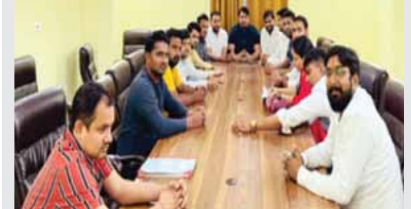
मोदी सरकार के 8 साल पूरा होने के उपलक्ष्य में तैयारियों को लेकर बैठक करते भाजपा नोएडा महानगर के पदाधिकारी।