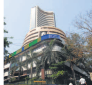
Private banks' weight in MF schemes was up to 17.3% in August from 16.2% in July.

banks by mutual funds may have contributed to the rally in the sector in August, when the Nifty Bank and Nifty Private Bank indices rallied nearly 10%, each, while Nifty PSU Bank jumped 8.06% outpacing the benchmark Nifty which was up around 3%.