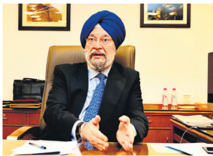
We are confident that Air India will be given to a new owner to keep the flag flying high, civil aviation minister Hardeep Singh Puri told Rajya Sabha.