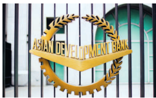
ADB, however, expects gross domestic product to rebound next fiscal with an 8% growth.

ADB's move follows rating agency S&P Global Ratings on Monday forecasting a 5% contraction in the Indian economy in FY21. Fitch Ratings and Moody's Investors Service have also lowered their estimates for FY21 to a reaction of 14.8% and 11.5%, respectively.