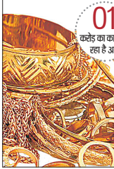
01 करोड़ का कारोबार रहा है अब

06 लाख करोड़ का सालाना कारोबार है दिल्ली में