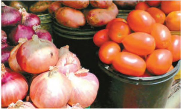
জুলাই মাসে দেশে খাদ্যপণ্যে মুদ্রাস্ফীতির হার ছিল তৃতীয় সর্বোচ্চ। এর মধ্যে ৪৮ শতাংশ খাদ্যপণ্যে মুদ্রাস্ফীতির হার ছিল ৬ শতাংশের

মদিও মূল স্ট্রেকের মুদ্রাস্ফীতির হার ছিল ৪.৯ শতাংশ। অর্থ মন্ত্রকের রিপোর্টে বলা হয়েছে, খাদ্যপণ্যে মুদ্রাস্ফীতি কমাতে ইতিমধ্যেই একাধিক ব্যবস্থা নিয়েছে কেন্দ্র। এখন নতুন ও মজুত ফসল বাজারে পৌঁছেতে শুরু করলে খাদ্যপণ্যের দাম কমবে। তবে বিশ্ব জুড়ে অনিশ্চয়তা ও দেশে অস্থিরতার কারণে আগামী মাসগুলিতে মুদ্রাস্ফীতির চাপ বাড়তে পারে।