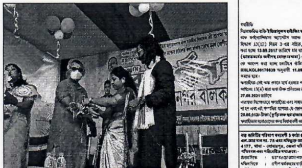
কলকাতার মাধ্যমে প্রচারিত প্রসঙ্গের স্মরণীয় মুহূর্তের পূর্ণাঙ্গ বরণের বালক সন্তান। বিহারে তদন্ত শুরু, শৌর্য সেনের বিরুদ্ধে মামলায় বস্তু উপস্থিত হলে কলকাতা ও রাধা বন্দ্যোপাধ্যায়ের সাক্ষাৎকার নিয়ে মামলা চলবে।

দীপলোক ফিন্যান্সিয়াল সার্ভিসেস লিমিটেড ফোন: ৯১ ১১১১১১ ১১১১১ ফোন: ৯১ ১১১১১১ ১১১১১ ফোন: ৯১ ১১১১১১ ১১১১১