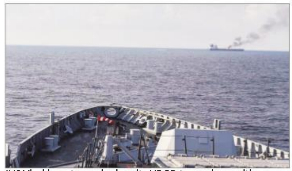
INS Visakhapatnam deploys its NBCC team along with fire-fighting equipment to render assistance

On a request from MV Marlin Luanda, INS Visakhapatnam deploys its NBCC team along with fire-fighting equipment to render assistance