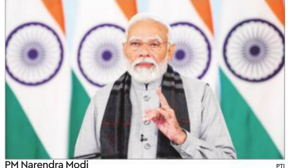
PM Narendra Modi

"In 2021, during discussions with you, I spoke about one-nation-one-legislative platform. I am happy that our Parliament and state legislatures are now working towards this