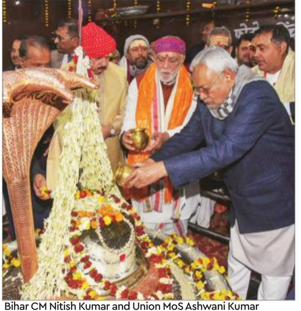
Bihar CM Nitish Kumar and Union MoS Ashwani Kumar Choubey offer prayers at a temple in Buxar on Saturday

Requesting anonymity, BJP sources said instructions have