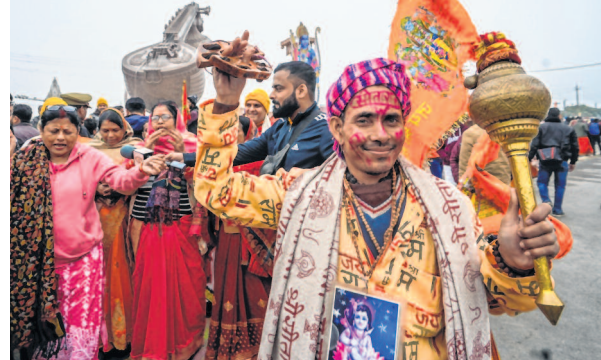
Devotees dance and sing at the Lata Mangeshkar Chowk ahead of Ram Mandir ceremony on Friday

After touring the temple town of Ayodhya, the chariot has been parked on the banks of the Sarayu river where it is catching the attention of tourists and devotees. The huge chariot looks like a temple with carvings in golden colour. On one side of the chariot are pictures of various places it has visited as well as from the day of the start of its tour.