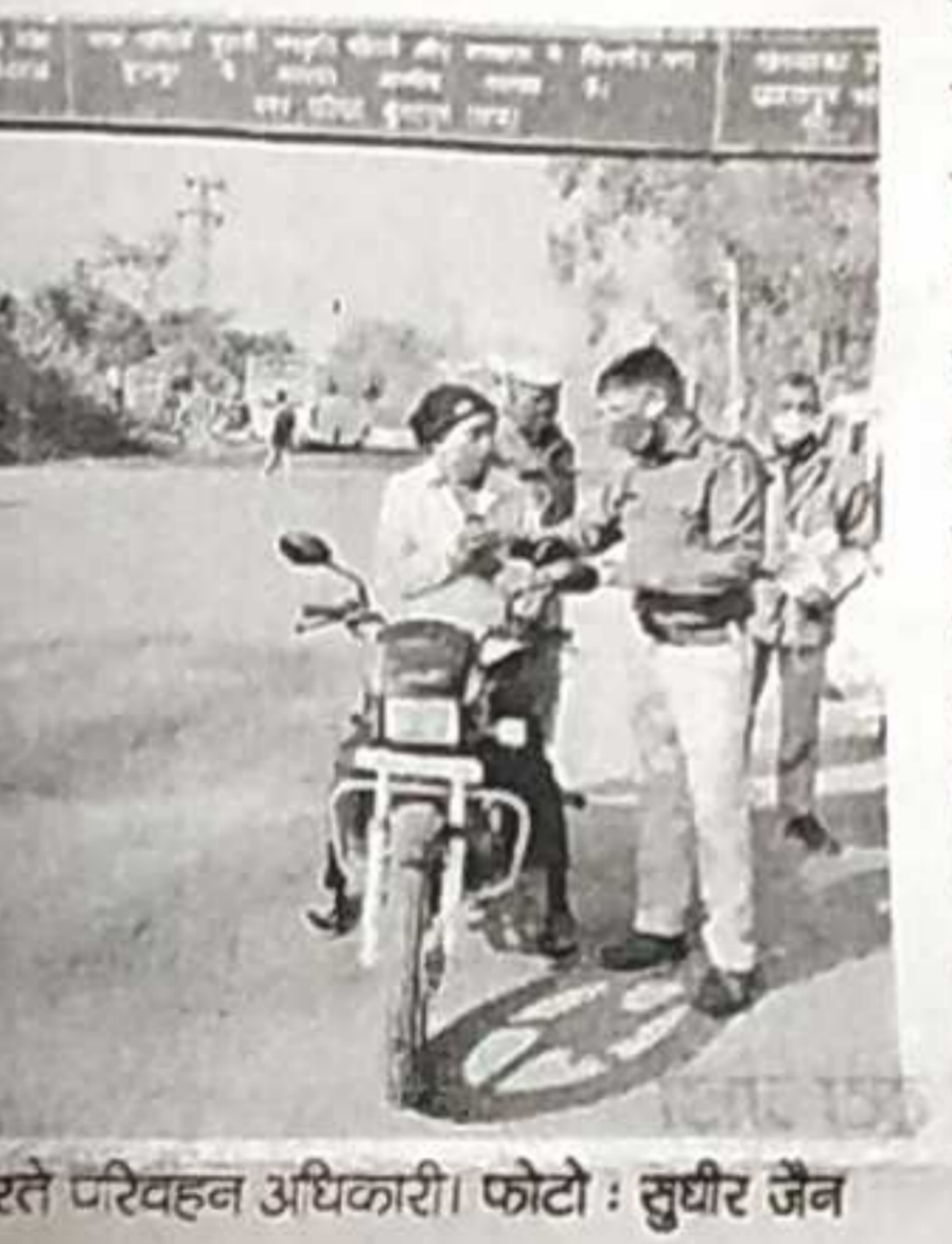
इंजारपुर। सुरक्षा समार के तहत वाहनधारियों को सजाइए करते परिवहन अधिकारी।

वांसवाड़ा (प्रातःकाल संवाददाता)। सचल विधिक सेवा केन्द्र एवं मोबाइल लोक अदालत वाहन के माध्यम से शुरूवार को गढ़ी के बोरी, आंजा व अरधूना क्षेत्रों में विधिक सेवा कार्यक्रमों का प्रचार प्रसार किया गया।