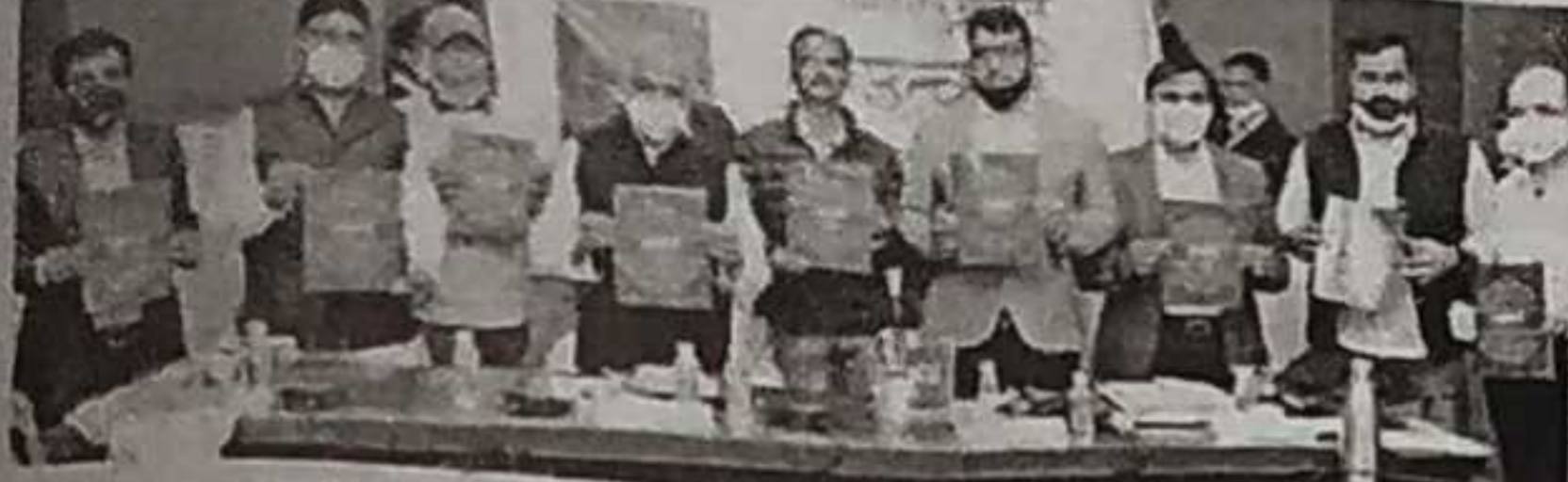
नाथद्वारा उत्कर्ष स्मारिका का विमोचन करते विधानसभा अध्यक्ष डॉ जोशी, नया अध्यक्ष, उपाध्यक्ष व अन्य।

नाथद्वारा (प्रातःकाल संवाददाता)। नाथद्वारा नगर पालिका बोर्ड के एक वर्ष के कार्यकाल की उपलब्धियों व विकास कार्यों पर आधारित स्मारिका उत्कर्ष का विमोचन विधानसभा अध्यक्ष डॉ जोशी के आतिथ्य में सम्पन्न हुआ।