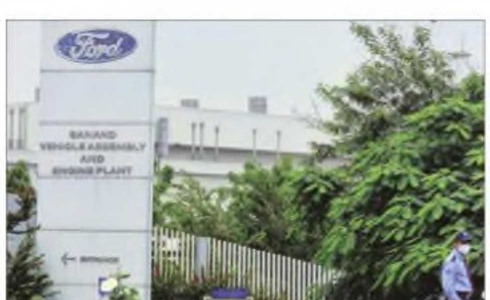
The deal includes entire land and buildings, a vehicle making plant along with machinery and equipment, and employees

India signed today is beneficial to all stakeholders and reflects Tata Motors' strong aspiration to further strengthen its market position in the passenger vehicles segment and to continue to build on its leadership position in the electric vehicle segment.