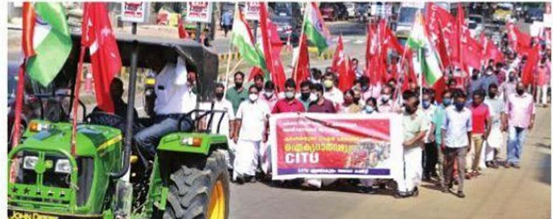
റബ്ബർ ദിനത്തിൽ ഡൽഹിയിലെ കർഷകരുടെ ട്രാക്ടർ പരേഡിന് ഐക്യദാർഢ്യം നയിച്ച സിംഗിൾ യൂണിറ്റിന്റെ നേതൃത്വത്തിൽ എറണാകുളം നഗരത്തിൽ നടത്തിയ പാലി.