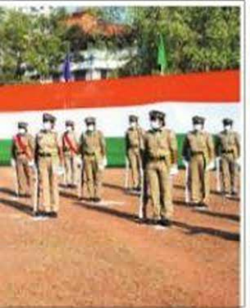
പോലീസ് ഉദ്യോഗസ്ഥർ ഉദ്യോഗസ്ഥർ എ.സി. മൊ