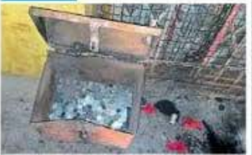
मनु : वैद्यक दुरुमान मंडिरातील कोवळेटी दुरवणी व छाती विलसक ठरवतेची घटना घडाली.