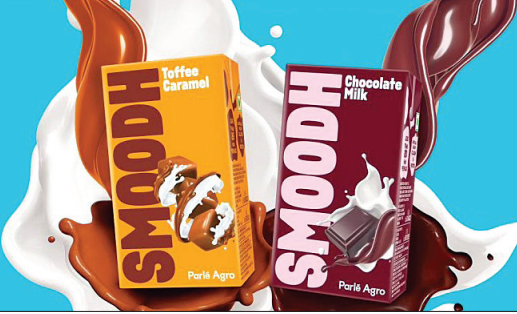
उत्पाद पेश किए जा सकें। कंपनी ने 85 मिलीलीटर टेट्रा पैक के लिए 10 रुपये की

कंपनी ने एक बयान में कहा कि इस विविधीकरण के साथ गहन शोध और आधुनिक और नयी तकनीकों में व्यापक निवेश हुआ है ताकि एक मजबूत डेयरी बुनियादी संरचना का निर्माण किया जा सके और भारतीय उपभोक्ताओं के लिए नए