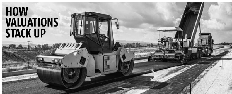
HOW VALUATIONS STACK UP

The news flow on order receipts is already encouraging. For instance, Dilip Buildcon has announced receiving the letter of acceptance (LoA) on September 9 from the National Highways Authority