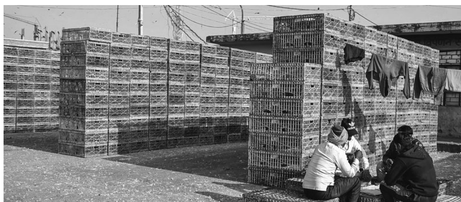
Ghazipur poultry market in Delhi wears a deserted look on Monday after the authorities closed it for 10 days because of bird flu. The Centre urged state governments, including Delhi, not to shut poultry markets and restrict sales based on "public perception", asserting that there were no scientific reports of transmission of bird flu to humans

All the players have rolled out campaigns to reach out to customers about the safety, quality, and hygiene of their offerings via social media, emails, and messages. "Sensitivity towards all viral diseases has gone up because of Covid-19. Whether bird flu or no bird flu, we should always be aware about the traceability of the food on our plate," said