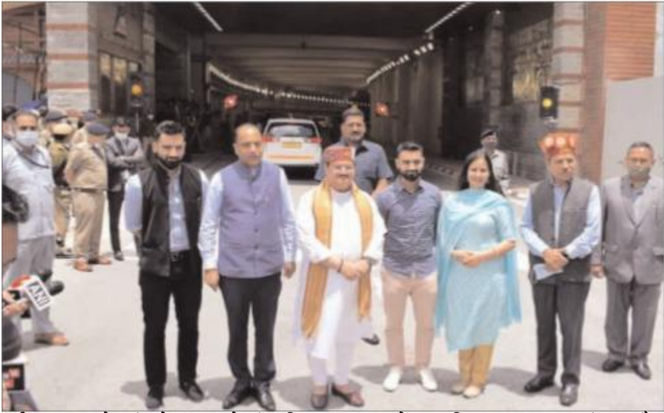
यूपीए सरकार ने सुरंग के काम को लंबा किया लेकिन मोदी की सरकार बनते ही तेजी से इस

उन्होंने कहा कि ‘अटल सुरंग देश की सुरक्षा में मजबूती का काम कर रही है। अटल जी का सपना था कि देश की सुरक्षा के लिए ऐसी सुरंग बने, जो अब पूरा हो गया है।’ उन्होंने कहा कि