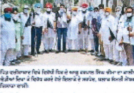
ਪ੍ਰਾਜੈਕਟ 'ਚੋਂ ਪਰਤੇ ਚੀਮਾ ਦੇਖਣ ਵਾਲੇ ਕਾਲੀਆਂ ਝੰਡੀਆਂ ਦੇਖ ਰਸਤੇ 'ਚੋਂ ਪਰਤੇ ਚੀਮਾ।

ਪੰਜ ਪੁੱਕ, ਫਤਹਿਗੜ ਸਾਹਿਬ ਵਿਖੇ ਮਾਮਲੇ ਵਜ਼ੀਰਾਬਾਦ 'ਚ ਲੱਗਣ ਵਾਲੇ ਸਨਅਤੀ ਪ੍ਰਾਜੈਕਟ ਦਾ ਕਾਲੀਆਂ ਝੰਡੀਆਂ ਦੇਖ ਰਸਤੇ 'ਚੋਂ ਪਰਤੇ ਚੀਮਾ।