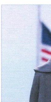
The vandalised statue of Christopher Columbus in Boston, Massachusetts

THE RAPIDLY UNFOLDING movement to pull down Confederate monuments around the US in the wake of George Floyd's death has extended to statues of slave traders, imperialists and explorers around the world, including Christopher Columbus, Cecil Rhodes and George Washington.