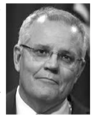
श्री टर्नबुल ने कहा है कि वह संसद की सदस्यता से इस्तीफा देने की घोषणा की है।

केनबरा, वाता। आस्ट्रेलिया के पूर्व प्रधानमंत्री मैल्कम टर्नबुल ने कहा है कि वह संसद की सदस्यता से शुक्रवार को इस्तीफा दे देंगे। बीबीसी ने स्थानीय मीडिया रिपोर्ट का हवाला देते हुए मंगलवार को बताया कि श्री टर्नबुल ने पार्टी के विरोधी गुट की ओर से प्रधानमंत्री पद से हटाये जाने के बाद संसद की सदस्यता से इस्तीफा देने की घोषणा की है। श्री टर्नबुल के स्थान पर श्री स्कॉट मोरिसन को पिछले सप्ताह चुना गया था। श्री टर्नबुल ने कहा कि हाल की घटनाओं से आस्ट्रेलिया के लोग अचंचित हैं। श्री टर्नबुल के इस्तीफे से खाली हुई सीट पर उप चुनाव कराना पड़ेगा जिससे श्री मोरिसन को संसद में हासिल बहुमत खतरे में पड़ सकता है।