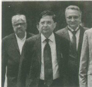
...ra with Justice Ranjan Gogoi and Justice Kurian Joseph

...process, after receipt of the opinion of the CJI, the Law Minister will appear before the Prime Minister who is the resident in the matter of ap-