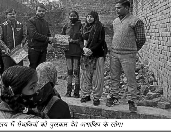
फूलपुर में विद्यालय में मेधावियों को पुरस्कार देते अभावित के लोग।