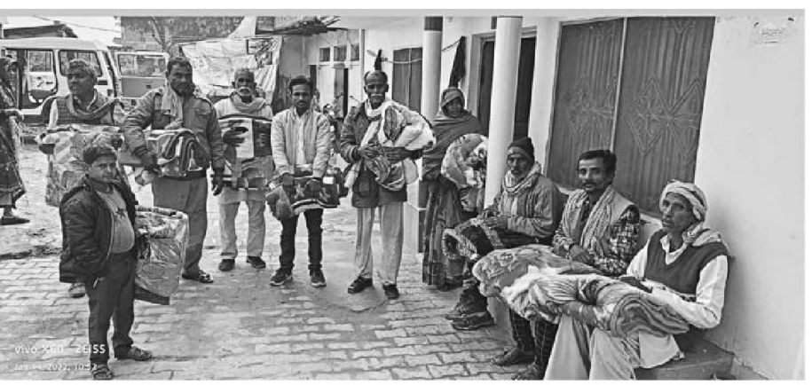
टंड में कंबल मिलते ही मुस्कुराते लोग।

धूरपुर (प्रयागराज)। क्षेत्र के एक गांव में शुक्रवार की शाम गांव से बाहर दूसरे घर में खाना देने जा रही कक्षा सात की किशोरी के साथ बाइक सवार दो युवकों ने किशोरी को घेर कर रोका लिया। किशोरी को पकड़ लेते युवक सुनसान जगह की ओर खींचने लगे। किशोरी ने शोर मचाया तो आस पास के लोग दौड़े और एक युवक को पकड़ लिया। सूचना पर पहुंची पुलिस ने आरोपित को पकड़ थाने ले आई और दोनों के खिलाफ केस दर्ज कर लिया। मिली जानकारी के अनुसार धूरपुर के एक गांव की एक कक्षा सात में पढ़ने