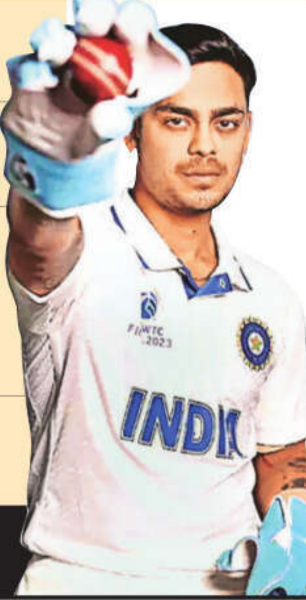
Shreyas Iyer (left) and Ishan Kishan will be paid only match fees even if they play for India in the immediate future