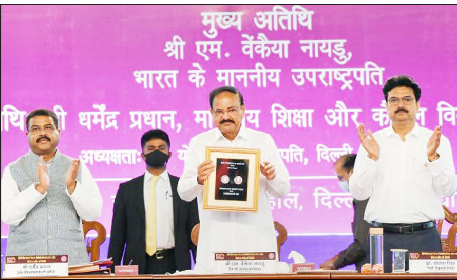
નવી દિલ્હીમાં દિલ્હી યુનિવર્સિટીની શતાબ્દીની ઉજવણી નિમિત્તે યુનિવર્સિટીના નોર્થ કેમ્પસ ખાતેના એક કાર્યક્રમમાં ઉપસ્થિત ઉપરાષ્ટ્રપતિ એમ. વેકેયા નાયડુ સ્મૃતિમાં ૧૦૦ રૂપિયાનો સિક્કા રીલીઝ કરી રહ્યા છે. સાથે કેન્દ્રીય શિક્ષણ મંત્રી ધર્મેન્દ્ર પ્રધાન અને દિલ્હી યુનિવર્સિટીના વાઈસ ચાન્સેલર યોગેશ સિંઘ પણ નજરે પડે છે.

આપતા જણાવ્યું કે દિલ્હીમાં ટેસ્ટિંગ વધવાની સાથે જ પોઝિટિવિટી રેટ (૭થી) વધીને પ થઈ ગયો છે. તેમણે કહ્યું કે, "પોઝિટિવિટી રેટની ગણતરી ત્યારે થવી જોઈએ જ્યારે કોઈ જિલ્લા કે રાજ્યમાં પુરતા પ્રમાણમાં પરીક્ષણ થતું હોય અને તેની સામે વસ્તી પ્રમાણે જે આંકડો મળે તેના આધારે પોઝિટિવિટીનો રેટ નક્કી કરવો જોઈએ." એટલે કે ટેસ્ટિંગની સંખ્યા ઘટી હોય અને કેસમાં વધારો થાય તે સ્વાભાવિક છે અને આમ થવાથી તેને ચોથી લહેરની ગણતરીમાં ના લઈ શકાય. ICMRના એડિશનલ ડિરેક્ટર જનરલ ડૉ. સમિરાન