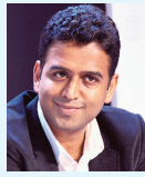
NITHIN KAMATH CO-FOUNDER, CEO ZERODHA

If you spend ₹3,000-5,000 to acquire a customer, it's tough to generate that much revenue. The lifetime value of a customer at a very deep discounted pricing model isn't ₹3,000, which is what our competition is spending. They claim to have as many users as us, but in terms of AUM or revenue, they are still far behind.