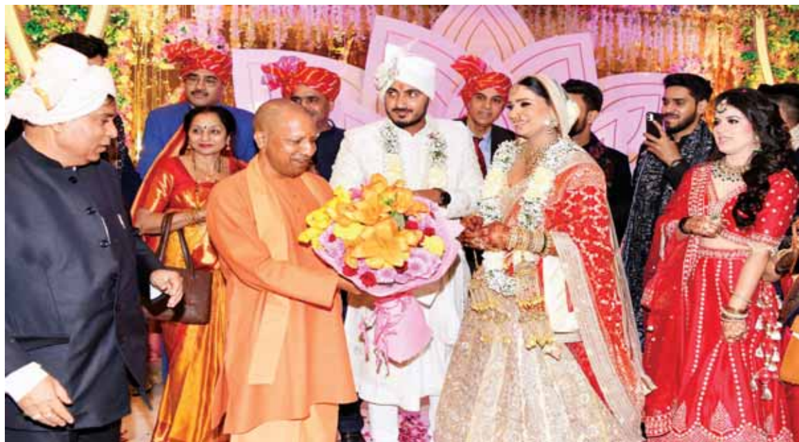
Chief Minister Yogi Adityanath attending the marriage ceremony of BJP leader Markandeya's daughter in Gurugram on Wednesday

each in Sector Delta-2, five plots of 2,580 square metre each in Sector Alpha-2, a plot of 11,500 square metre in Sector Alpha-2, a plot of 12,000 square metre in Sector Ecotech-12, a plot of 10,000 square metre in Technozone-8, six plots of 10,400 square metre each in Sector 12, three plots of 10,600 square metre each in Sector 10, and a plot of 9,250 square metre in Sector 10.