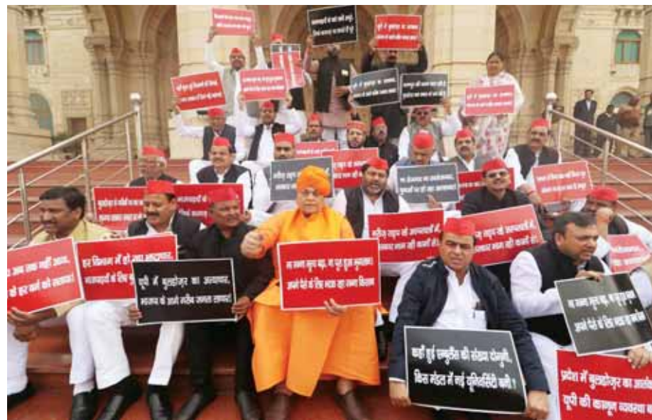
A new set of rules prohibiting the legislators from carrying phones, political posters or flags in the Uttar Pradesh Assembly came into force during the winter session.

Carrying banners with slogans on unemployment, patients facing problems in hospitals, use of bulldozers and farmers' problems related to irrigation, the Samajwadi Party (SP) MLAs sat on the stairs in front of the House. The SP members wore black clothes as a mark of protest on the first day of the winter session which began on Tuesday. One of the MLAs wore a kurta having anti-government slogans on it.