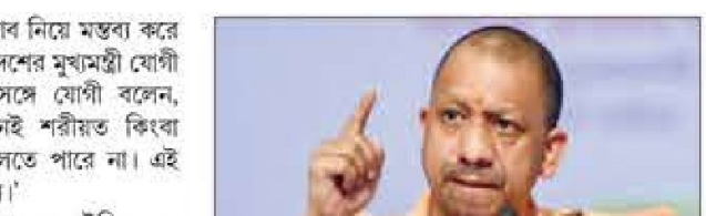
শরীয়ত মেনে নয়।' একদিকে যখন তাঁর রাজ্যে চলাছে বিধানসভা নির্বাচন, তাঁর দল এবং তাঁর নিজের ভাগ্য নির্ধারণ করছেন উত্তরাখণ্ডের মানুষ, তিক তখনই সাংবাদিকদের কাছে এই বার্তা দেন যোগী আদিত্যনাম।

লখনউ, ১৪ ফেব্রুয়ারি: ফের হিজাব নিয়ে মত্ববা করে খবরের শিরোনামে এলেন উত্তরাখণ্ডের মুখ্যমন্ত্রী যোগী আদিত্যনাম। সোমবার হিজাব প্রসঙ্গে যোগী বলেন, 'আমাদের দেশের সরকার কখনই শরীয়ত কিংবা ইসলামের কোনও নিয়ম মেনে চলতে পারে না। এই দেশের সরকার চলে সংবিধান মেনে।'