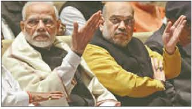
সম্মানকে আরও ত্বরান্বিত করতে পারে। তাই উত্তরাখণ্ডের সমস্ত ভোটারদের কাছে আমার আর্জি, রাজ্যের উন্নয়ন ও অগ্রগতির অংশ হয়ে উঠুন ভোট দিন।

নয়াদিল্লি, ১৪ ফেব্রুয়ারি: তিন রাজ্যে আজ ভাগ্য নির্ধারণের বড় পরীক্ষা। একদিকে যেমন দেশের বৃহত্তম রাজ্যের মানুষেরা দ্বিতীয় দফায় নিজেদের মতদান করবেন, তেমনি আবার উত্তরাখণ্ড ও গোয়াতেও বিধানসভা নির্বাচন রয়েছে। বিগত পাঁচ বছরে শাসক দলের কাজে কতটা সন্তুষ্ট রাজ্যবাসী এবং আগামী পাঁচ বছরের জন্যও তাদের কী প্রত্যাশা রয়েছে, সবটাই ব্যালট বক্সেই স্থির হয়ে যাবে। সবমিলিয়ে তিন রাজ্যের ভোট গ্রহণ কেন্দ্র করে আজ সারাদিনই উত্তপ্ত থাকবে ভোটের ময়দান। সকার্কেই প্রধানমন্ত্রী নরেন্দ্র মোদি ও স্বরাষ্ট্রমন্ত্রী অমিত শাহ-ও সকলকে এগিয়ে এসে ভোট দিনেয়ার আর্জি জানান।